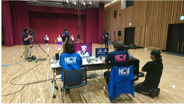
NCV(ケーブルTV)「アーティストライブ」収録風景…6月9日 (函館市の支援事業として実施された番組制作!!)