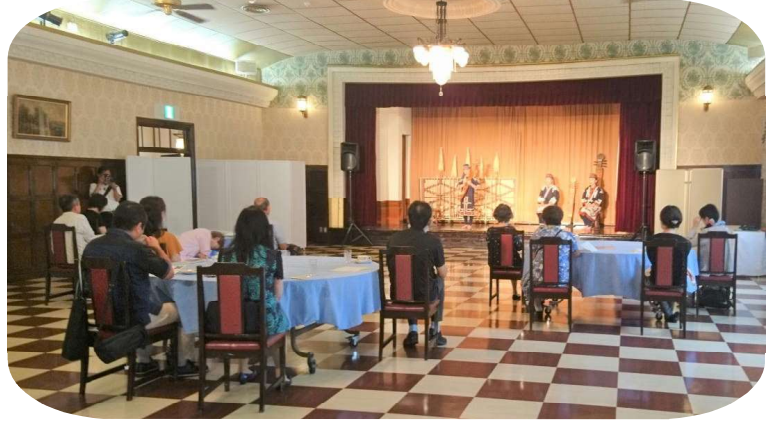
ようやく運行が始まった今年度の「四季島」…8月18日