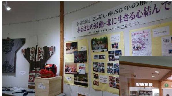
8月11～22日 「写真展」こぶし座55th …しらかば薬局ギャラリー (期間中、患者さん以外の来場も…) ※手作り小物の支援販売も行われた!