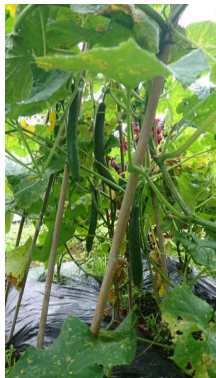
今年のこぶし座「青空農園」 (鈴なりトマトと新鮮キュウリ)